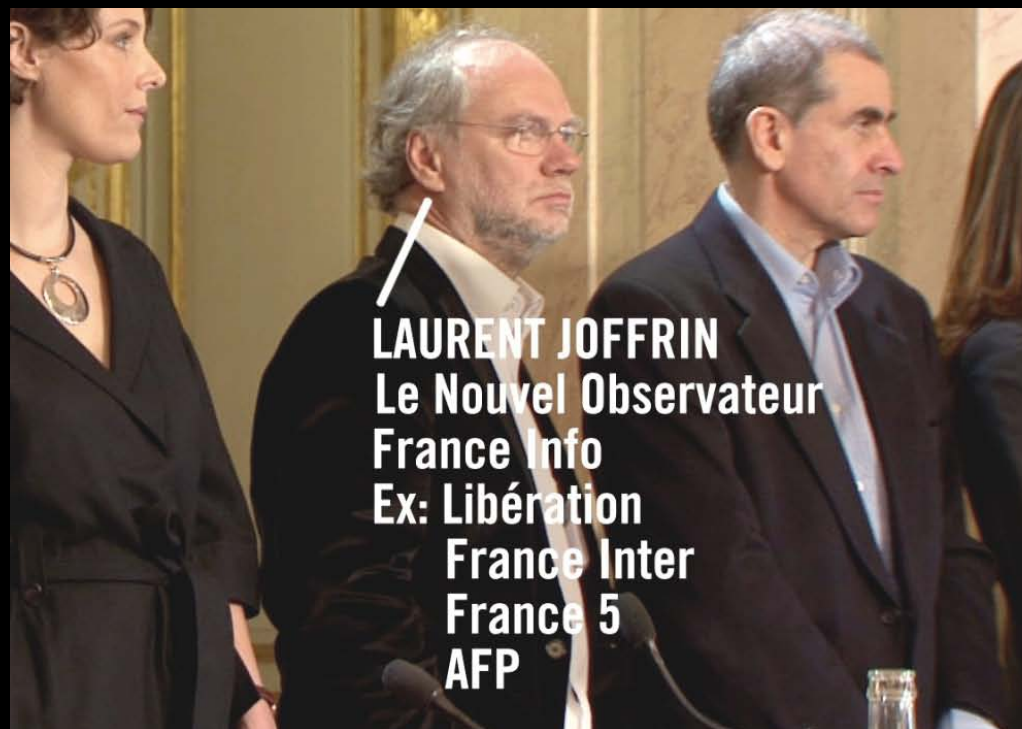
LAURENT JOFFRIN Le Nouvel Observateur France Info Ex: Libération France Inter France 5 AFP